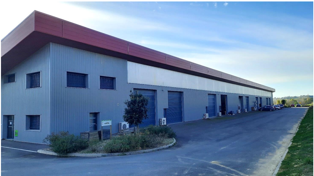
BATAC - Façade arrière (entrée atelier)