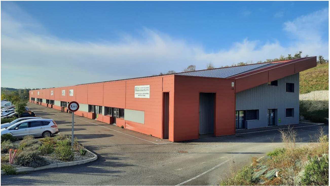
BATAC - Façade avant (entrée bureau)